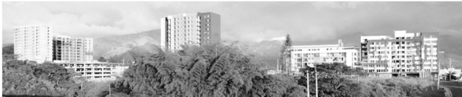
Imagen 1. Transformaciones en la estructura territorial de Armenia.

urbano de la ciudad, evidencia que han empezado a aparecer torres y edificios de proporciones considerables que irrumpen en el modelo tradicional de ciudad horizontal. Pero, ¿A qué se deben estos cambios? ¿Qué los originó? ¿Son estos cambios consecuencia de la nueva política pública en materia territorial adoptada mediante el POT 2009-2023? ¿Es esta dinámica urbanística favorable para el desarrollo, o es solo un cambio en la imagen física de la ciudad? ¿Qué papel ha jugado la política pública frente a esta nueva dinámica y qué retos adicionales debe asumir? ¿Impactan estos cambios físico-espaciales en la calidad de vida de los habitantes locales? Y finalmente, ¿cuáles han sido las transformaciones que ha generado el Modelo de Ocupación planteado por el POT adoptado en 2009, en la estructura territorial del municipio de Armenia, Quindío?