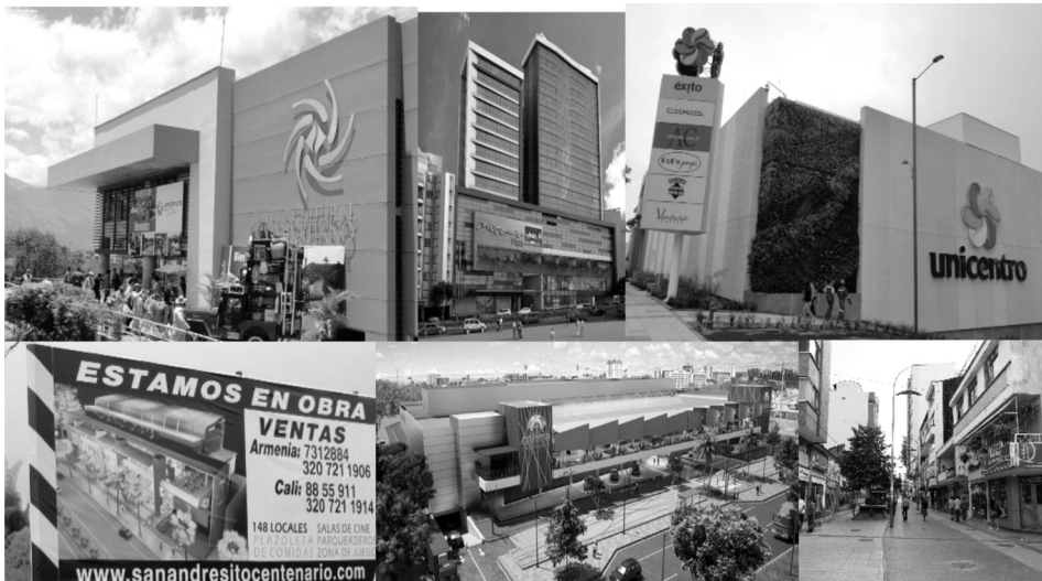
Imagen 3. Nuevos hitos en la estructura territorial de Armenia.